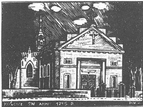
KOŚCIÓŁ ŚW. ANNY 1795 R. PIV.