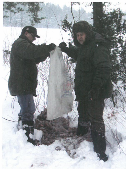
Członkowie koła łowieckiego „Cyranka” w Kolnie podczas akcji.

Z łowieckim pozdrowieniem darz bór Zarząd K.Ł. „Cyranka” w Kolnie