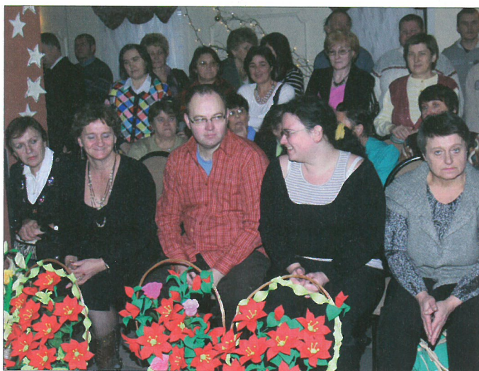
Uczestnicy projektu „Rozwijam Skrzydła”

Projekt „Rozwijam Skrzydła” rozpoczął się 22 czerwca 2009 roku i powstał dzięki współpracy Powiatowego Centrum Pomocy Rodzinie z gminnymi i miejskimi Ośrodkami Pomocy Społecznej w Kolnie, Małym Płocku, Stawiskach, Grabowie i Turośli. Dziewięćdziesiąt procent dofinansowania do projektu pochodziło ze środków Europejskiego Funduszu Społecznego