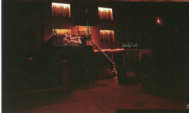
Miejsce III - Dorota i Mirosław Pycia