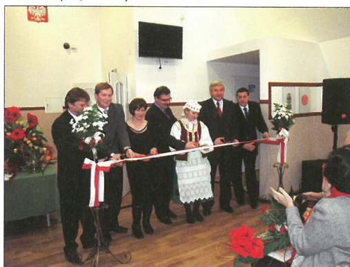
Uroczyste przecięcie wstęgi.

Sala widowiskowa została wyposażona w sprzęt nagłośnieniowy, komputerowy, oświetleniowy, meble oraz zostało zakupione wyposażenie do pomieszczeń kuchennych: meble, sprzęt elektryczny, naczynia, garnki, sztuczce, dokupiono również sprzęt nagłaśniającego na organizację imprez plenerowych. Ogólna wartość projektu 134 tysiące złotych.