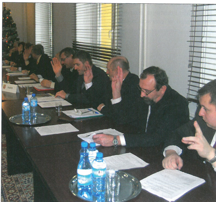
Radni jednogłośnie przegłosowali projekt budżetu