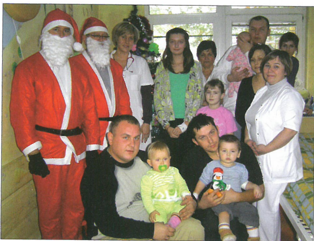
Mikołaje wraz z małymi pacjentami i ich opiekunami