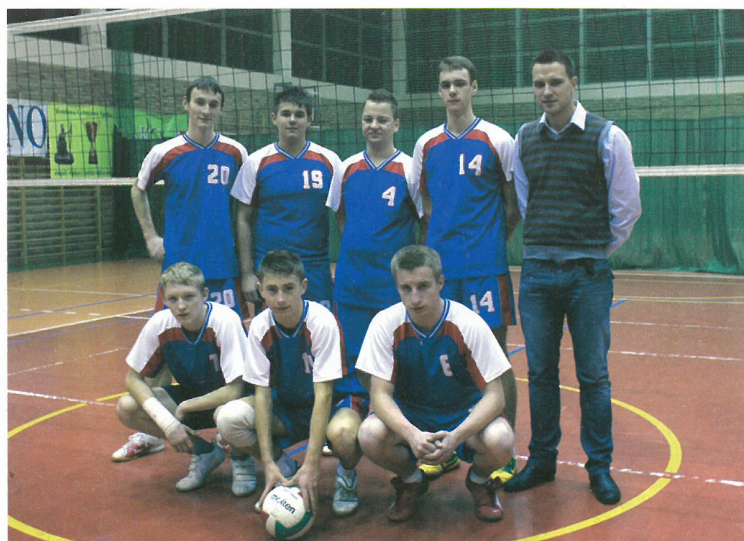
Zwycięzca drużyna LO Kolno wraz z trenerem