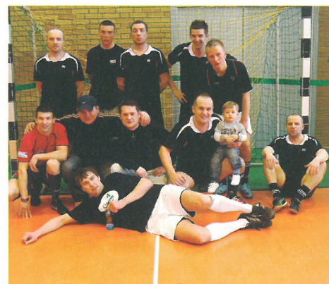
Zespół Mlekoopł - III miejsce

Przedstawiamy końcowe wyniki II edycji Międzyzakładowej Ligi Halowej Piłki Nożnej o Puchar Burmistrza Miasta Kolno