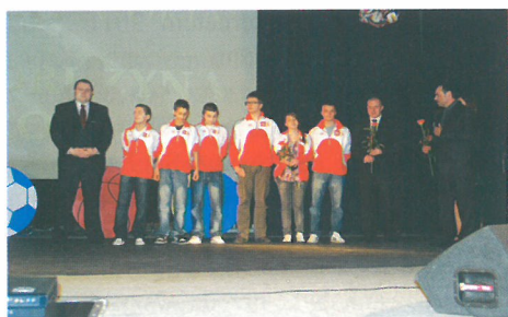
Międzyszkolny Klub Sportowy Karate Fudokan „Dragon” - zwycięzcy w kategorii Drużyna Roku 2010