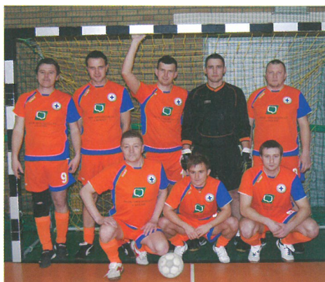
Zespół Ratownicy WOPR - II miejsce